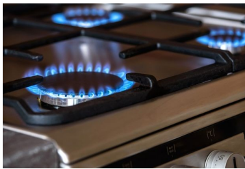
1. ábra "A" típusú gázkészülék