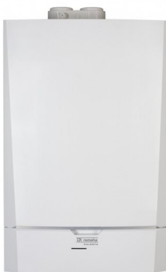
1. ábra "C" típusú gázkészülék