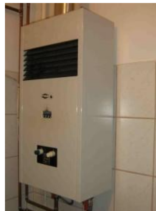
2. ábra "B" típusú gázkészülék